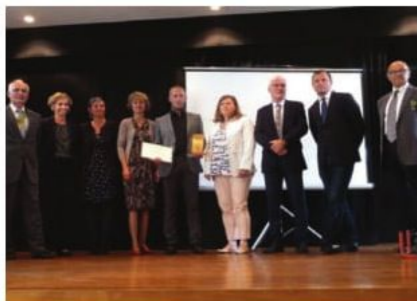
Le président entouré des élus de l'île

Un trophée a été remis au syndicat d'élevage agricole de Belle-ile pour l'organisation d'un comice agricole depuis 1970 permettant de transmettre les traditions paysannes insulaires.